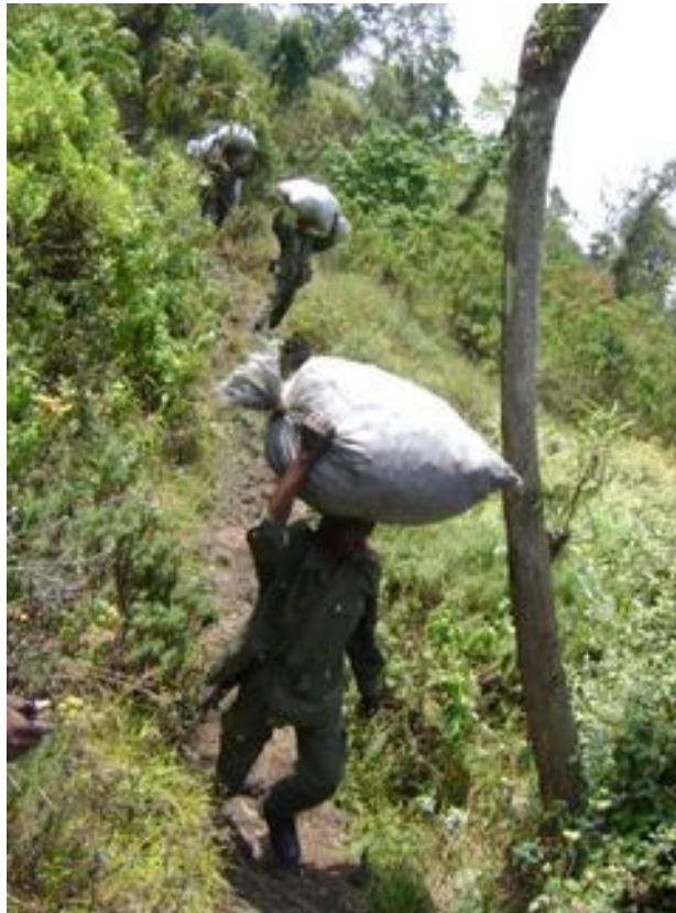
Transport de Charbon de Bois par des éléments FARDC armés et en uniforme.