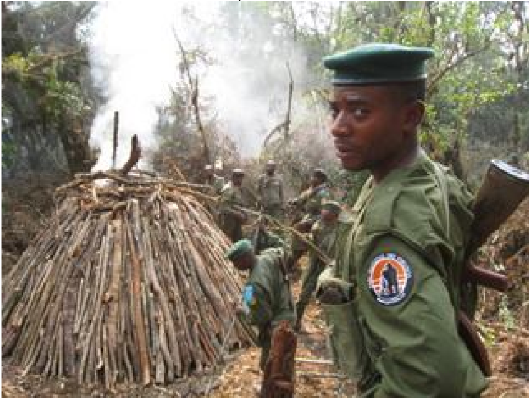
Destruction des fours en préparation par les gardes de l'ICCN