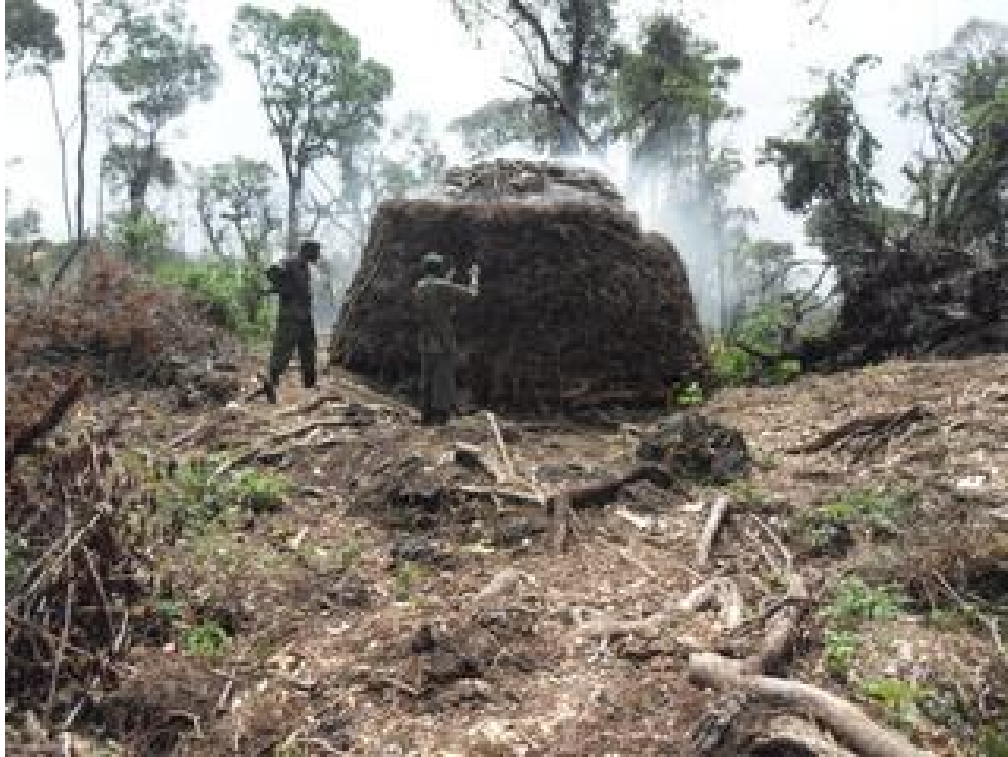
Un four à charbon de bois à l'intérieur du Parc National

Démanteler le système de trafic du charbon de bois au sein du Parc National des Virunga.